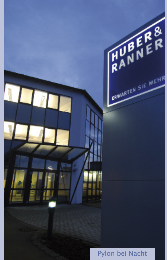
Pylon bei Nacht