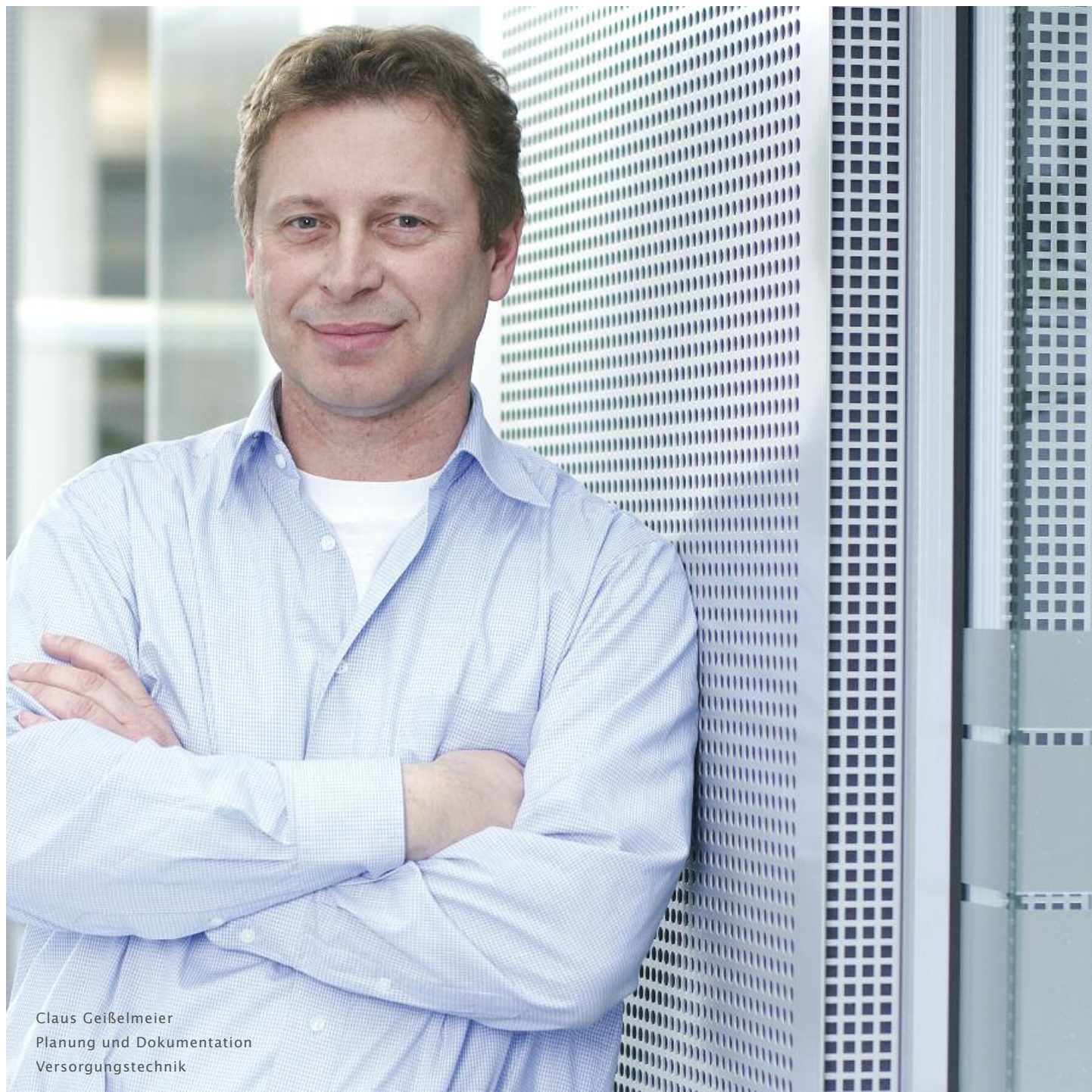
Claus Geißelmeier Planung und Dokumentation Versorgungstechnik